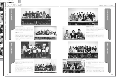
ゼミ・研究室集合写真